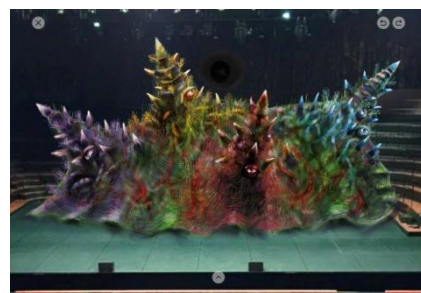
沢則之による怪物「フンババ」のデザインスケッチ