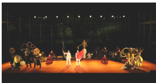
『イナバとナバホの白兔』2016年 駿府城公園にて

北海道小樽市出身。1991年にフランス、1992年に文化庁在外研修派遣でチェコへ。以後、ブラハを拠点に世界20ヶ国以上で公演、また、チェコ国立芸術アカデミー演劇・人形劇学部を始め、多くの教育現場で講座、ワークショップを行う。ヨーロッパ文化賞「フランツ・カフカ・メダル」授与、EU文化都市賞など、国際的受賞多数。日本国内では、NHK「みんなのうた」映像制作、「SWITCH インタビュー 達人達」出演、東京オリパラ大会の公式文化プログラム「東京2020NIPPON フェスティバル〜巨大人形プロジェクト『モッコ』」の人形デザイン設計および人形製作操演総指揮を担う。極小から巨大まで、あらゆる人形（＝フィギュア）を創造し操演するところから、フィギュアアートシアターの第一人者とされる。