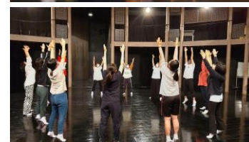
上:過去の「こども大会」の様子 下:SPAC演劇アカデミー美技の様子