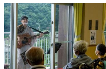
高齢者福祉施設での「SPAC出張ラヂロ局」(2020年)

演劇をもっと身近に! 静岡県内各地の幼稚園・保育園、学校、図書館、ギャラリー、カフェ、高齢者施設などへSPACの俳優・スタッフが出向き、様々な演劇体験をお届けします。「おはなし劇場」「出張劇場」などの鑑賞型プログラムから、演劇やダンスのワークショップのほか戯曲を声に出して読む「リーディング・カフェ」などの参加型プログラムまで、地域のコミュニティにあわせたプログラムを展開しています。