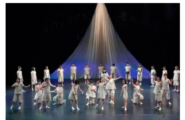
SPACシアタースクール『オフェリアと影の一座』(2019年)

学校では触れることの少ない「演劇の面白さ・奥深さ」を静岡県の子どもたちと保護者の方々に知っていただくため、2007年にスタート。参加者は、SPAC俳優による指導のもと、「舞台に立つためのからだづくり」を学び、作品を創作・発表します。