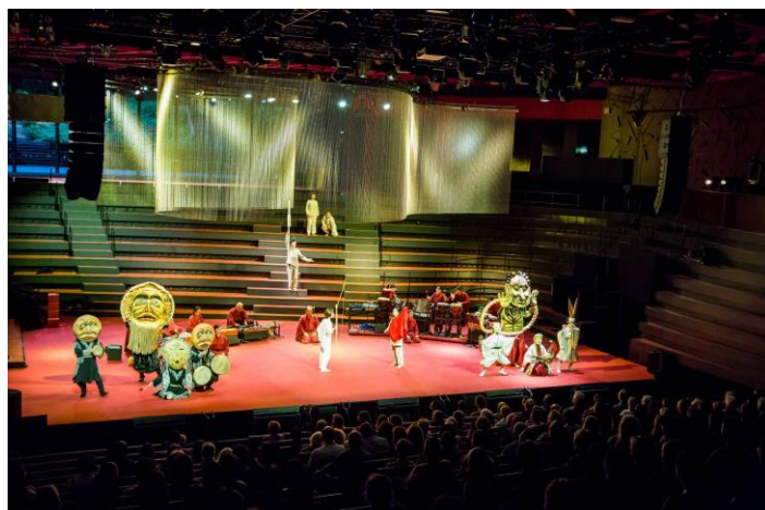
『イナバとナバホの白兔』(2019年)より 左：©Y.Inokuma 右：©NAKAO Eiji