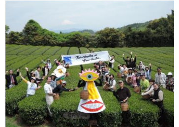
演劇祭イベント「お茶摘み体験をしよう! in舞台芸術公園」

毎年ゴールデンウィークに開催している国際演劇祭。同時開催の「ふじのくに野外芸術フェスタ」、ストリートシアターフェス「ストレンジシード静岡」とともに、注目の舞台芸術に出会えるフェスティバル。新緑の静岡ならではの「お茶摘み体験」など関連イベントも。