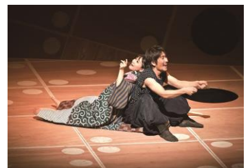
『ペール・ギュント』(2010年)

ノルウェーの片田舎を飛び出し、自由奔放なペール・ギュントは世界中を駆け巡る…。一人の男の波瀾万丈物語を、宮城は本作が書かれた明治期の「日本」のアイデンティティの話へと読み替えた。すごろくをモチーフにした仕掛け満載の舞台を出演者たちが駆け回る!