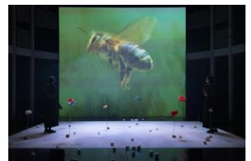
『みつばち共和国』(2020年)

四季を通して移ろう風景と、みつばちたちの神秘的な営み。養蜂家でもあった作家メーテルリンクのエッセイ『蜜蜂の生活』をもとにした演劇作品を、SPACが2020年に日本語版として創作。大人も子どもも楽しめる本作は好評を博し、22年、緑豊かな自然に囲まれた舞台芸術公園で再び上演される。