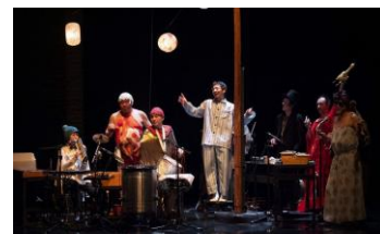
『妖怪の国の与太郎』(2019年)より

ドケチな商人アルパゴン惚れたのは、貧しい娘・・・しかも息子の恋人?! 金か、はたまた恋か? 喜劇王モリエールの代表作が、『妖怪の国の与太郎』に続くフランス人演出家ジャン・ランベール=ヴィルドとSPAC俳優のタッグで、新たな痛快ドタバタコメディに生まれ変わる。