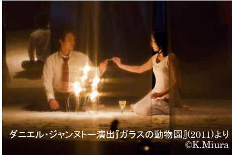
ダニエル・ジャンヌトー 演出『ガラスの動物園』(2011)より

現代フランスを代表する演出家の一人で、SPAC とはこれまで『ブラスティッド』(2009年)、『ガラスの動物園』(11年)、『盲点たち』(15年)で深い信頼関係を築いてきたダニエル・ジャンヌトー。彼が厳選したフランスの俳優と、SPACの俳優・スタッフが、全く新しいチェーホフの劇世界を描き出す。