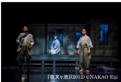
『夜叉ヶ池』(2012)

大正初めの山深い村里を舞台に、美しい幻想世界を描いた泉鏡花の傑作戯曲。失踪した東大生、その友人が山奥の村で見たものとは…？美しく艶やかな衣裳と、俳優の生演奏による心を揺さぶる音楽。伝説、自然、恋物語が交差する興奮の舞台が、7年ぶりに待望の再演。